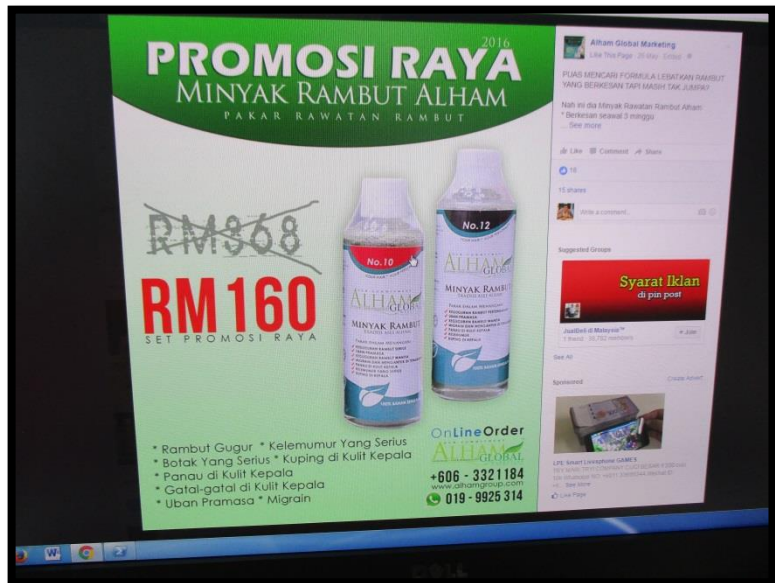
Membuat promosi di fb Alham Hair Care