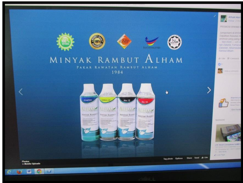
Antara produk yang dijual oleh En Alhamdulillah Manshor