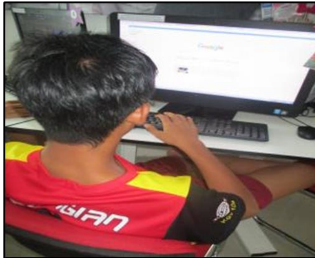
Caption : Latihan menggunakan enjin carian “Google” bagi mendapatkan maklumat yang diinginkan