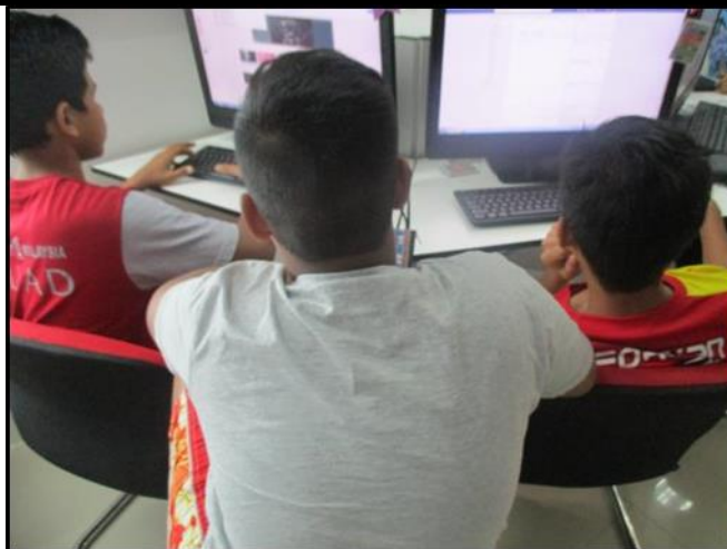
Caption : Antara kelas yang disertai oleh peserta