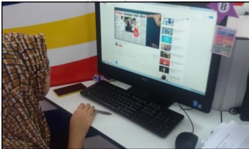
Caption : Aktiviti penerangan Klik Dengan Bijak kepada peserta