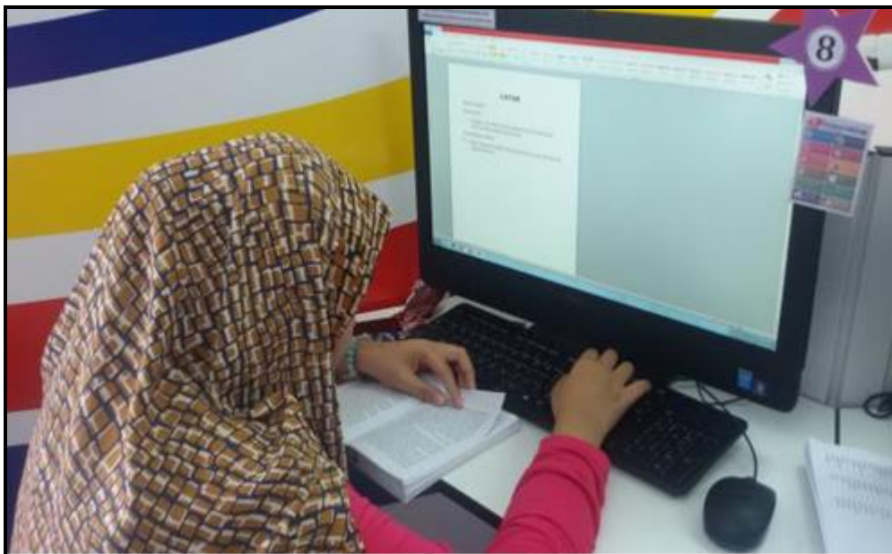
Caption : Latihan Microsoft Office Word 2010 iaitu menaip latihan komsas berpandukan Novel Merentang Gelora (Novel Pentaksiran Tingkatan 3)