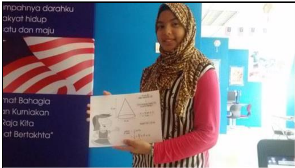
Caption : Peserta menggunakan nota formula subjek Matematik yang dibekalkan oleh petugas Pi1M untuk mengulangkaji pelajaran